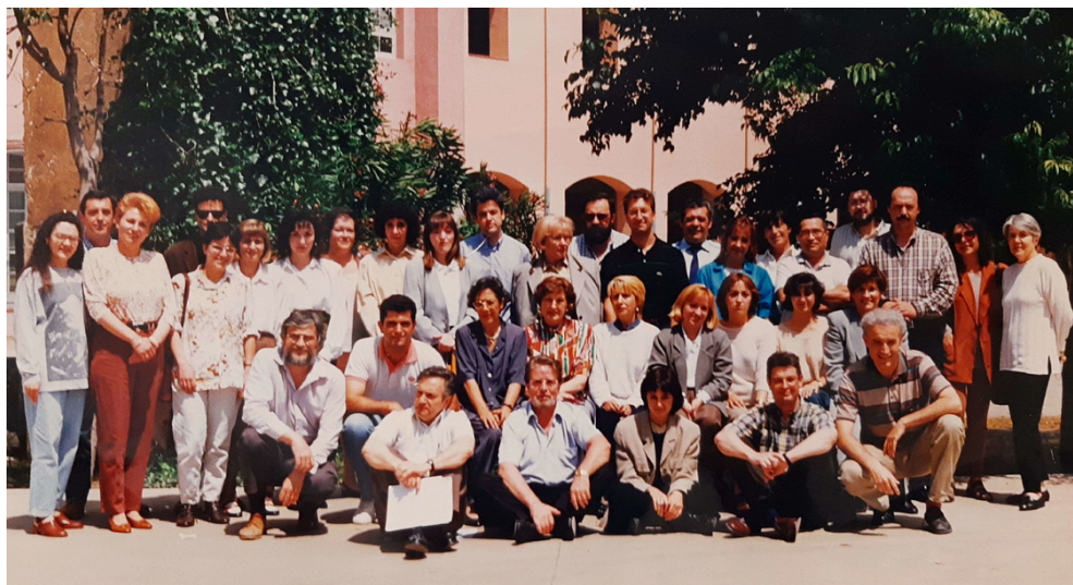
Professorat de l'INS Narcís Monturiol (anys 90)

Companya, companys, allà on sigueu... Una abraçada molt gran!